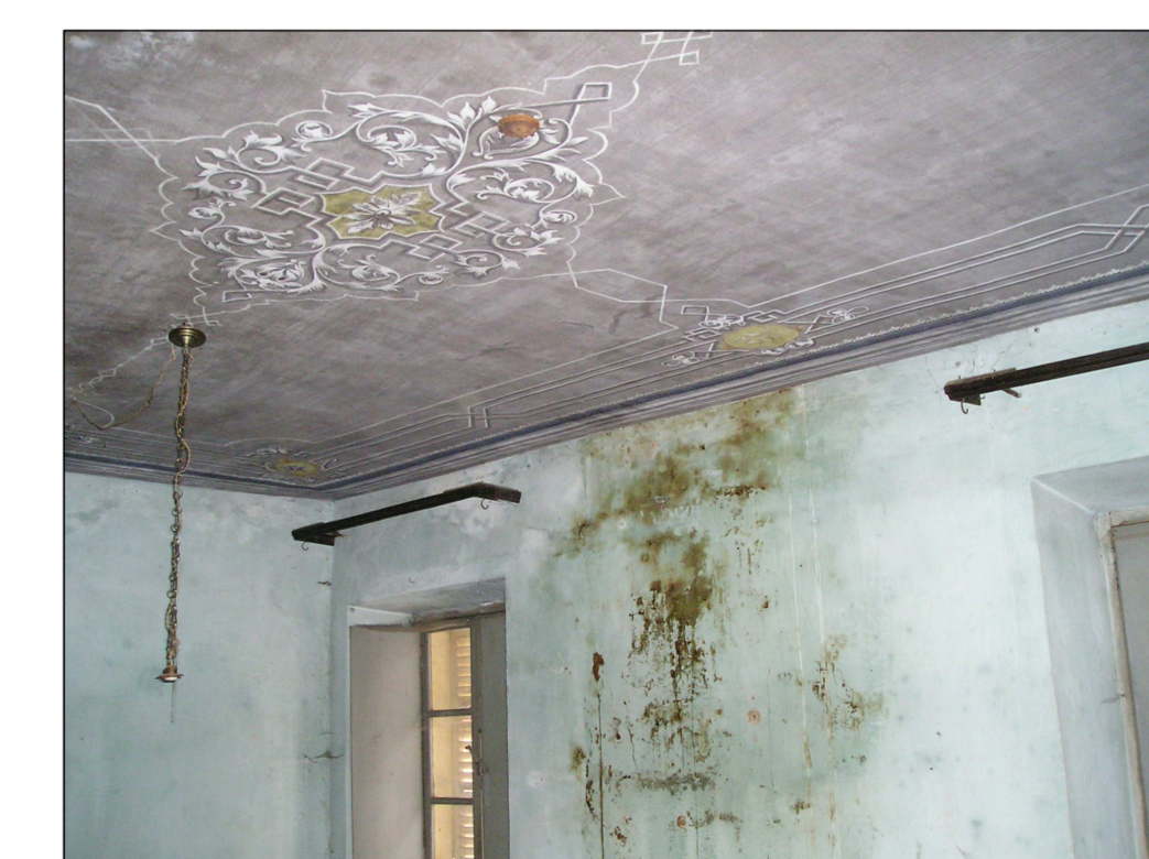
LOCALI AL 1° PIANO