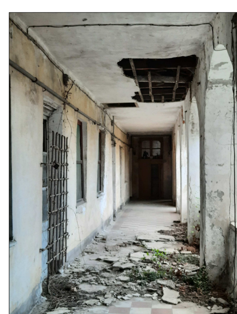
CORRIDOIO PORTICATO AL 1° PIANO