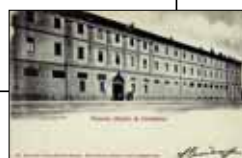
Scuola di cavalleria