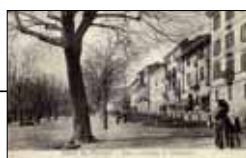
Viale e Stradale Fenestrelle