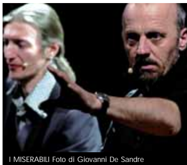
I MISERABILI

CASA DI BAMBOLA (L'ALTRA NORA) Di Ibsen, Regia di Leo Muscato Con Lunetta Savino e con Paolo Bessagato, Riccardo Zinna, Salvatore Landolina, Carlina Torta,