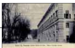
Piazza Palazzo di Città