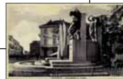
Monumento ai caduti