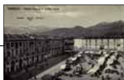
Piazza Cavour e portici nuovi