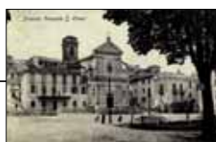
Piazzale Santa Croce