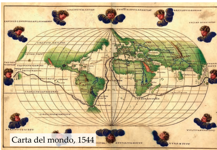
Carta del mondo, 1544