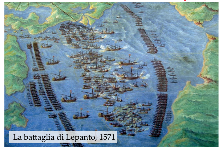
La battaglia di Lepanto, 1571