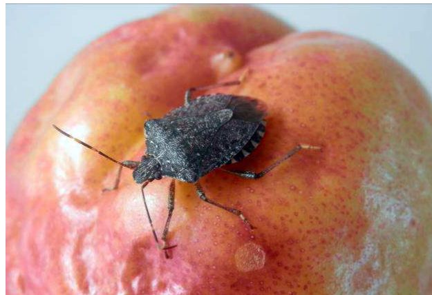
Danno su pesco

Considerando che si tratta di un insetto particolarmente dannoso, con popolazioni destinate a crescere anno dopo anno, è senz'altro utile tentare di eliminare gli adulti che cercano riparo nelle abitazioni, tanto più se si presentano in numeri consistenti. Cimici e altri "intrusi" possono essere