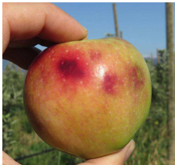
Danno su melo

preventivamente "scovati" dai loro ricoveri (cassonetti, anfratti, etc.) utilizzando i classici elettrodomestici atti alla pulizia e successivamente