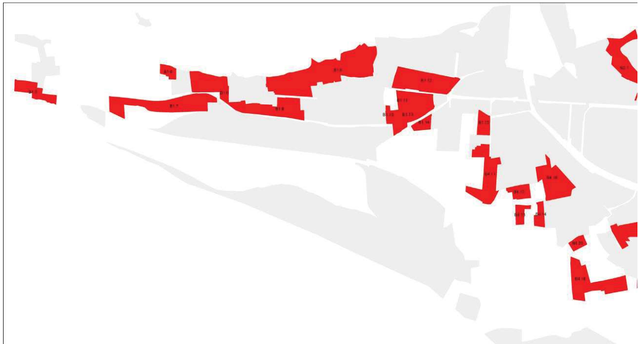
Estratto zone "C" del PRGC vigente riclassificate in zone "B" dalla Variante Generale - ABBADIA