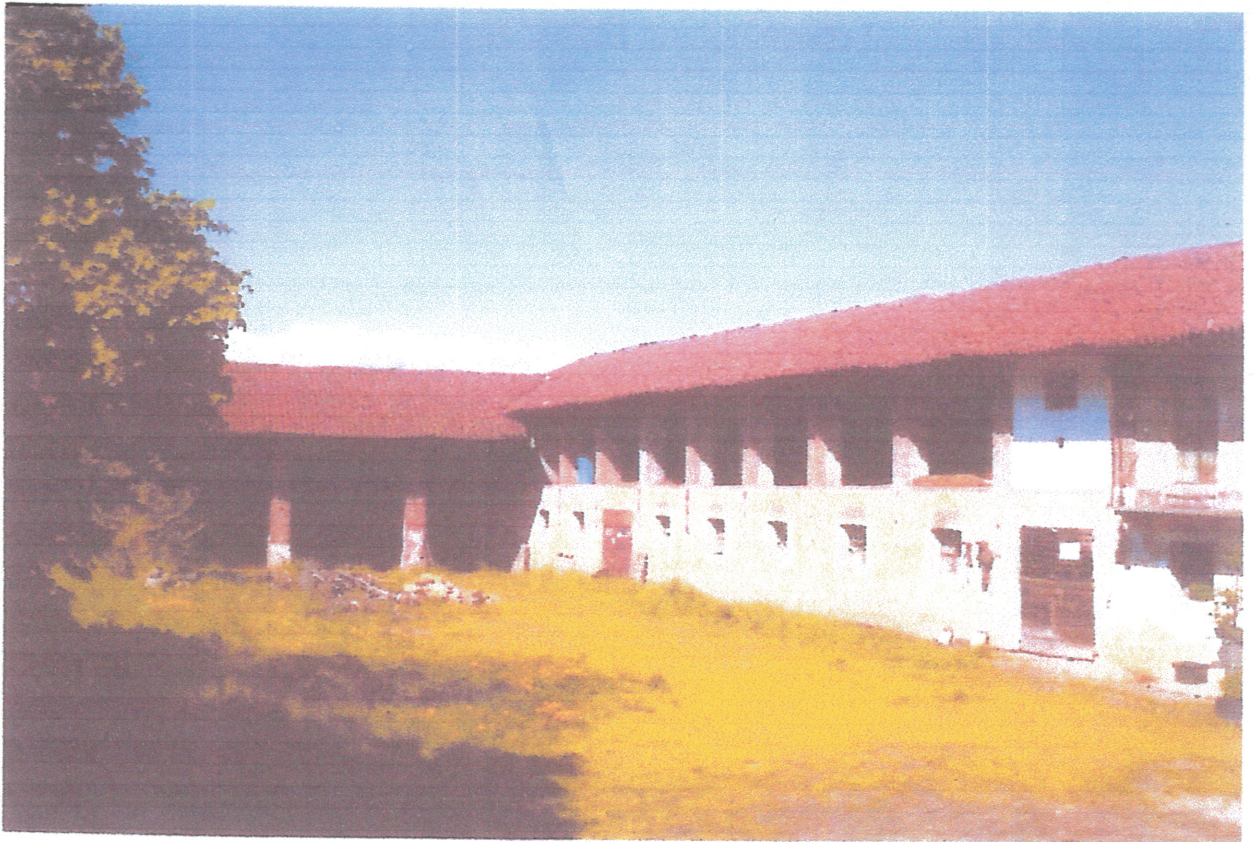
VISTA DAL CORTILE: IL PORTICATO DELLA "MANICA OVEST"