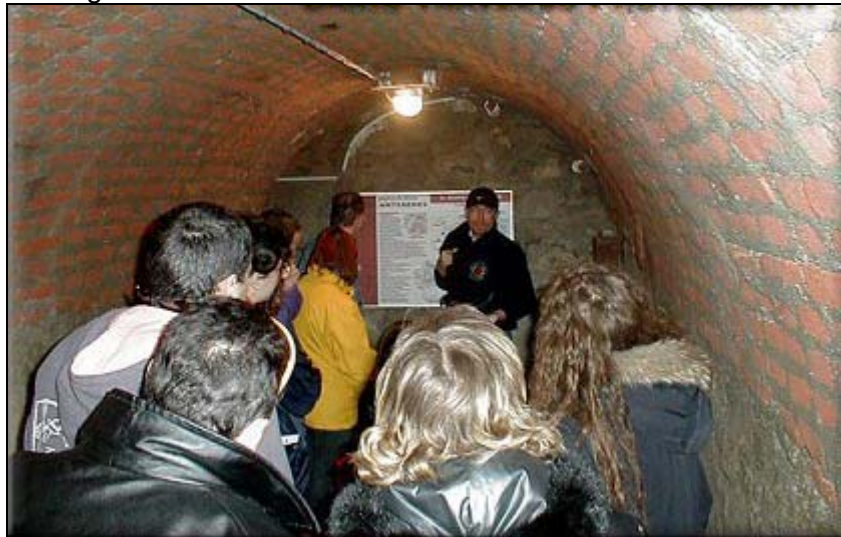
Visita ai Rifugi

Risultato che si potrebbe ottenere con uno specifico allestimento museale che dia rilevanza all'aspetto evocativo e scenografico.