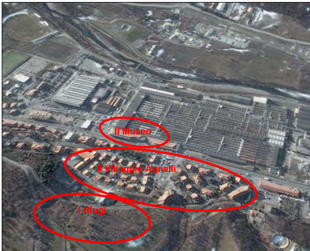
Vista satellitare dell'ambito di intervento

L'intervento, oltre che nella presente Relazione, è individuato e ulteriormente descritto nella Tavola n. 1 allegata. Si riporta un'immagine satellitare dell'ambito di intervento.