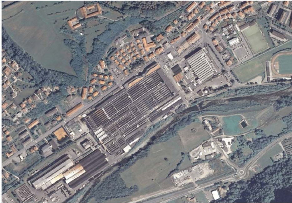
Ortofoto digitale Provincia di Torino (base originale in scala 1:5000)