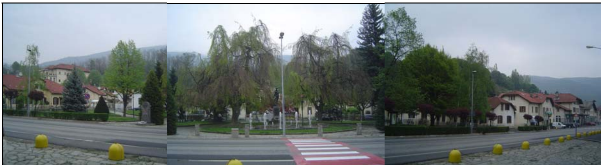
Il Villaggio Agnelli visto dal Museo