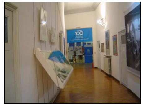
L'attuale allestimento museale