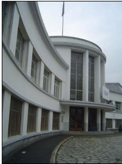
L'entrata principale del Museo

Oltre quanto riportato nella Tavola 1 , si riportano alcune immagini fotografiche del contesto in cui si inseriranno le opere, contesto, come già riferito di elevatissimo interesse architettonico-urbanistico e di alto valore documentario della cultura industriale.