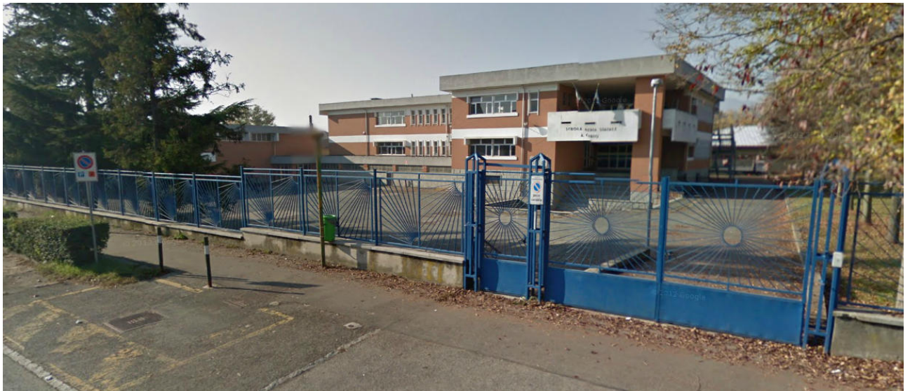
Foto 3: contesto

Il cantiere si trova nell'area recintata di proprietà del comune di Piossasco, in posizione centrale. Il fabbricato può essere raggiunto da via Volvera e la proprietà risulta recintata su tutti i lati. Gli accessi sono ben segnalati, trattandosi di una scuola. Il traffico è di tipo veicolare ad intensità media, con punte negli orari di apertura e chiusura della scuola.