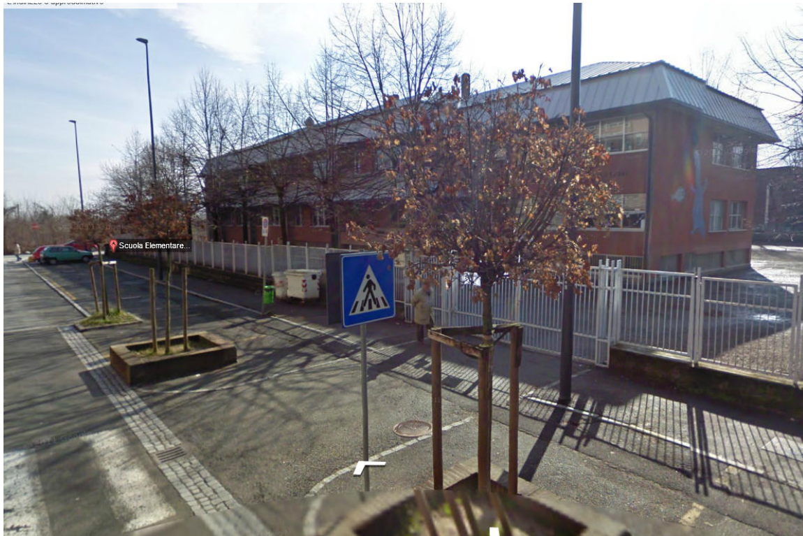
Foto 3: contesto

Il cantiere si trova nell'area recintata di proprietà del comune di Piossasco, in posizione centrale. Il fabbricato può essere raggiunto da via Dante Alighieri e la proprietà risulta recintata su tutti i lati. Gli accessi sono ben segnalati, trattandosi di una scuola. Il traffico è di tipo veicolare ad intensità media, con punte negli orari di apertura e chiusura della scuola.